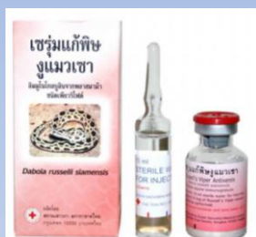
เซรุ่มต้านพิษงูเฉพาะชนิด