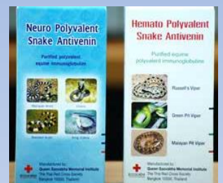
เซรุ่มต้านพิษงูรวม