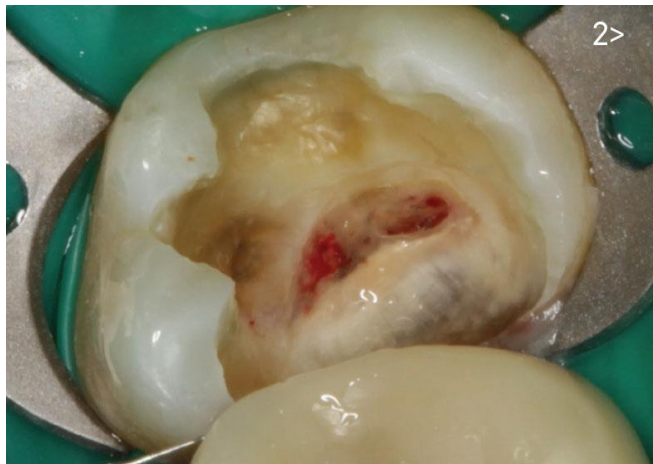
รูปภาพแสดงฟันกรามผุขนาดใหญ่จนทะลุโพรงประสาทฟัน สังเกตได้ว่าฟันซี่นี้สูญเสียเนื้อฟันไปมากกว่า 50%

A: ฟันที่รักษารากฟัน “ส่วนใหญ่” มักมีเหตุมาจากฟันผุขนาดใหญ่จนทะลุโพรงประสาทฟันแล้ว นั่นหมายความว่าปริมาณเนื้อฟันหายไปแล้วมากกว่า 30% ร่วมกับการสูญเสียโครงสร้างเนื้อฟันด้านบดเคี้ยวจากรูเปิดรักษารากฟัน ทั้งหมดนี้ทำให้ฟันหลังรักษารากฟันมีความอ่อนแอมากกว่าฟันปกติ จึงจำเป็นต้องได้รับการบูรณะเพื่อป้องกันไม่ให้ฟันแตกหัก ซึ่งส่วนใหญ่แล้วเป็นครอบฟันและเดือยฟัน