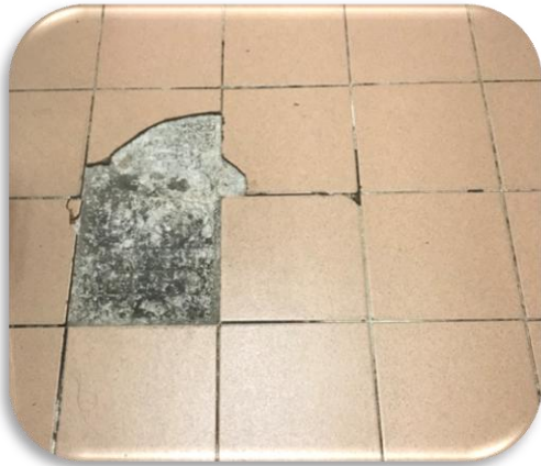
ก่อนทำกิจกรรม