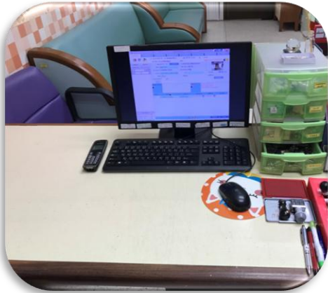
ก่อนทำกิจกรรม