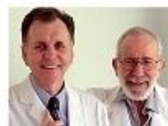
Robin Warren & Barry Marshall ค้นพบเชื้อช่วงต้นศตวรรษ 1980